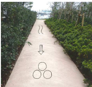
案内表示やデザイン的使用