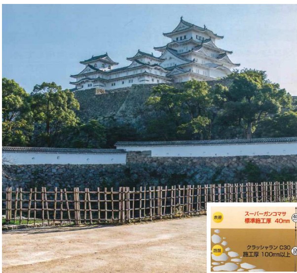
スーパーガンコマサ