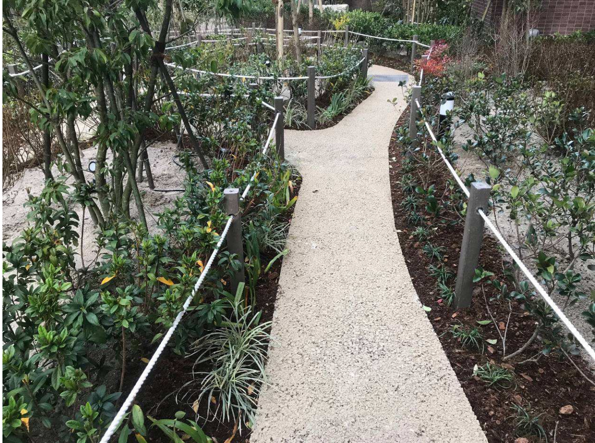
リフワ角杭 茶 60×60mm L1.500mm ローフ穴あき 10mm クレモノローフ 福岡 公園