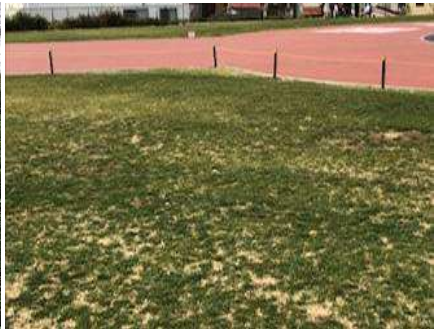
養生中芝生庭の立ち入り禁止杭