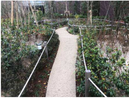
リフレ角杭 60x60mm L1,500mm 穴あき使用