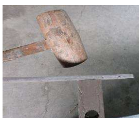
角杭頭部にリフワ板を当てて打ち込む