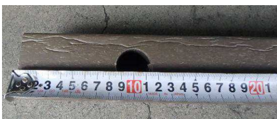
ローフ穴あき 10mm 穴位置・大きさは自