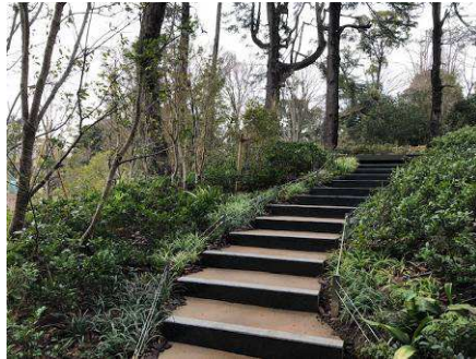
マンション庭階段向け境界角杭