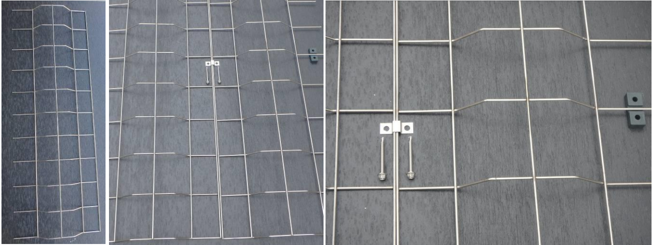
TSO-A 1m x 2m